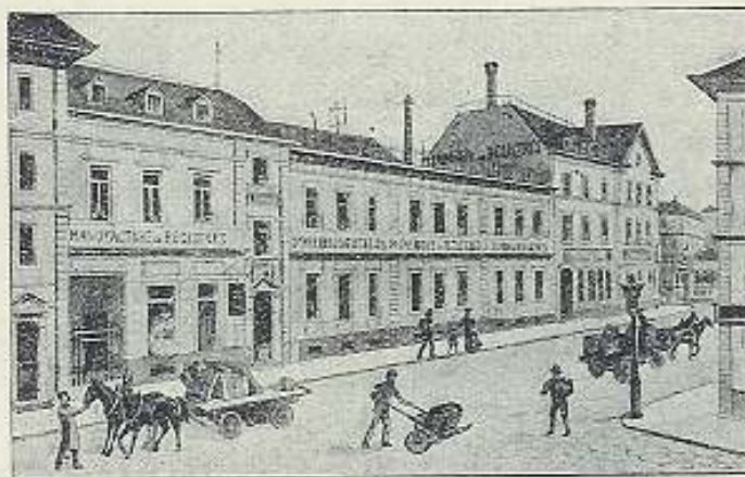
Fabriklokalisäten 1900-1909, Florastrasse

Während den ersten Monaten wurde das Geschäft im bisherigen Umfang weitergeführt; die eigentliche Tätigkeit umfasste die Herstellung von Papiersäcken und Druckerarbeiten aller Art u. deren